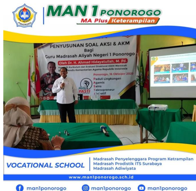
Gambar 3. Bimbingan teknis bagi guru MAN 1 Ponorogo

Kemudian terkait dengan capaian dari indikator peningkatan mutu pendidikan yang ketiga, yaitu pengembangan kompetensi dan kemampuan siswa dapat dilihat dari nilai harian, ulangan, dan prestasi lain baik secara internal maupun eksternal, individu maupun kelompok. Adapun dari data yang telah didapatkan dalam kegiatan observasi peneliti, peserta didik MAN 1 Ponorogo memiliki beragam jenis prestasi mulai dari prestasi secara individual hingga berkelompok, dari antar sekolah hingga nasional. Prestasi secara individu meraih juara, medali perunggu, medali, perak hingga medali emas, diantaranya dari lomba cipta puisi, tilawah, MTQ, IT, fotografi, desain, olah raga, atletik, dan juga olimpiade. Untuk prestasi kelompok diraih dari lomba robotik sebagai Juara Harapan II di ITS, lomba vlog di IAIN Ponorogo sebagai peringkat 5 dan 7, juara II dan kategori best picture dalam lomba cinematic vlog di ITS, sebagai finalis 15 besar Nasional Robot MRC Jakarta/Roapetrik, juga Finalis KOPSI Layanan Kesehatan Pasien Covid di RSUD Ponorogo. 44